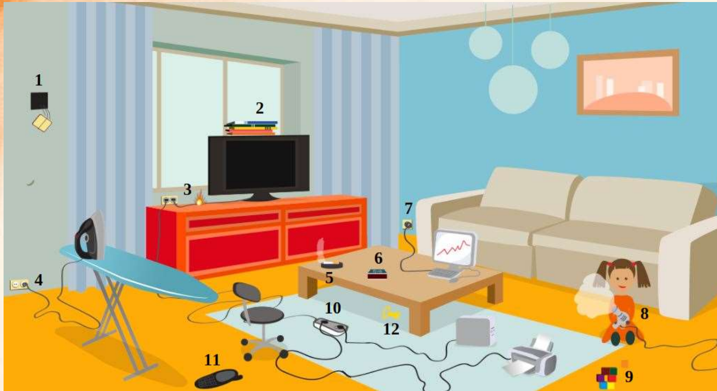
Рис. 3 Проверь найденные нарушения пожарной безопасности в гостиной