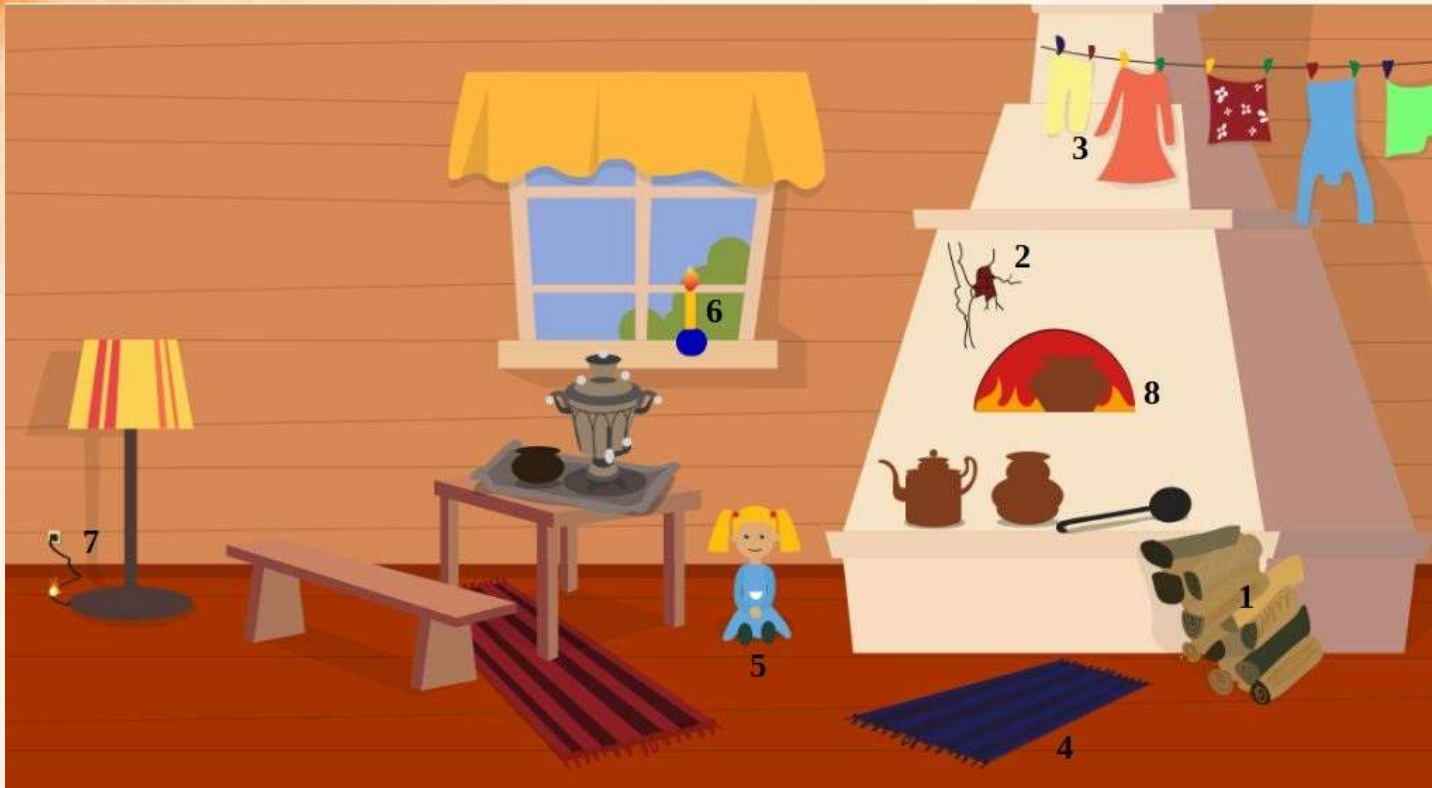
Рис. 1 Проверь найденные нарушения пожарной безопасности в доме