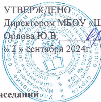
График заседаний Психолого-педагогического консилиума на 2024-2025 учебный год